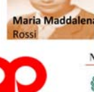
Maria Maddalena Rossi