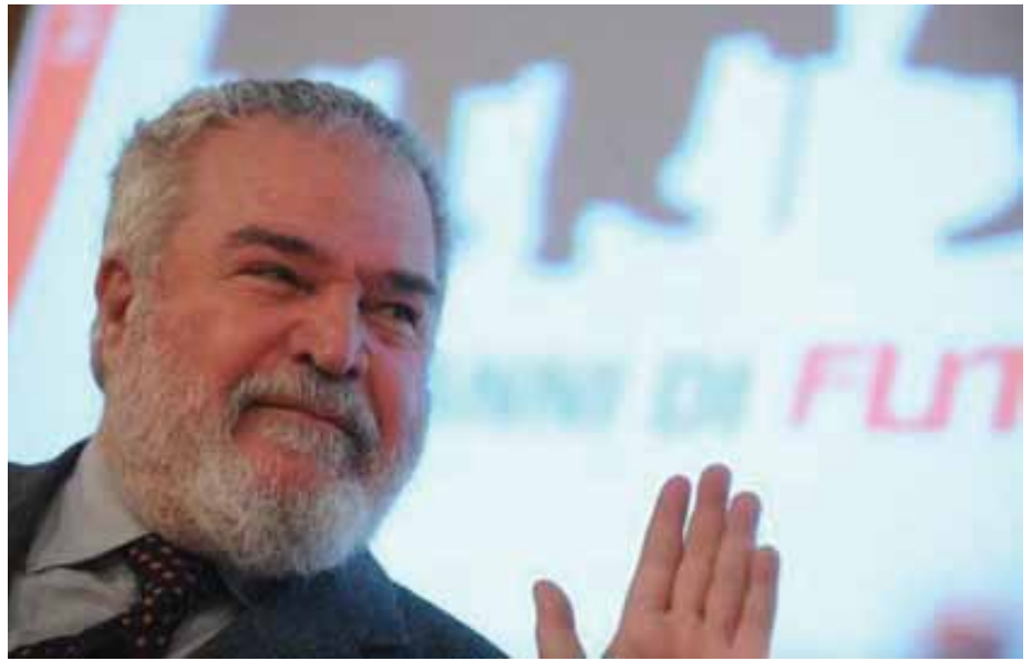
Carpi fino all'ultimo ha dedicato la sua vita all'antifascismo

Da allora ci rendemmo conto che non solo la DC non era più quella di sempre ma che anche il PCI rappre-