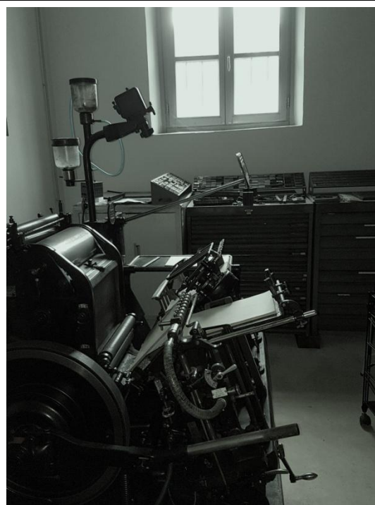
Museo della stampa Clandestina Torre Pellice

Rientro a Torre Pellice passando da Chiotin, Pra d'Gay, Rio Cros, Giordanotti intorno alle 17,00.